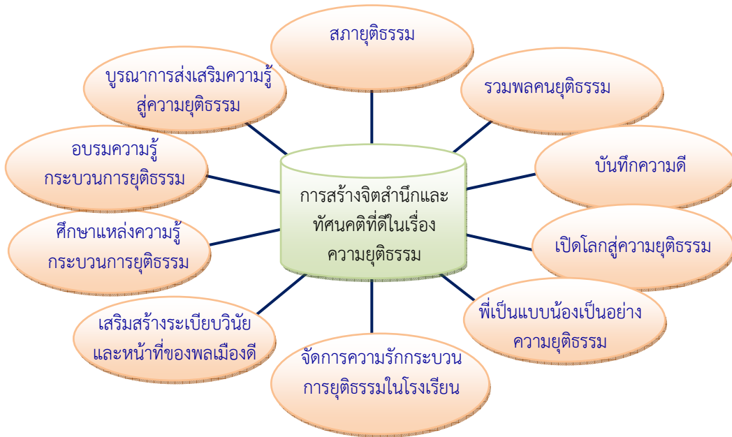
แผนภาพรูปแบบกิจกรรมการสร้างจิตสำนึกและทัศนคติที่ดีในเรื่องความยุติธรรม