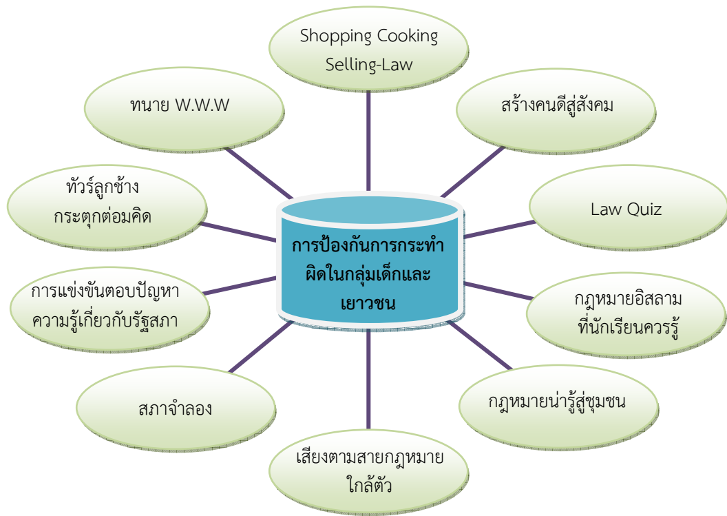
แผนภาพรูปแบบกิจกรรมการป้องกันการกระทำผิดในกลุ่มเด็กและเยาวชน