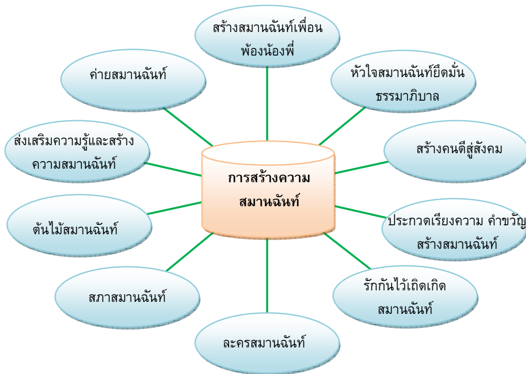
แผนภาพรูปแบบกิจกรรมการสร้างความสามัคคี